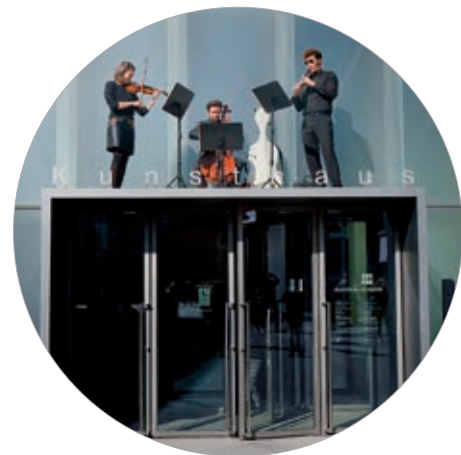
Ensemble Pagon Interventionen im Rahmen der Ausstellung Peter Zumthor – Dear to Me, 2017

2 Magic Art Box | Kind Spielerisch Englisch lernen im KUB! Nach einer bilingualen Führung werden die erlernten Begriffe kreativ umgesetzt und in der Magic Art Box gesammelt. Für Kinder im Alter von 5 bis 10 Jahren. Beitrag: € 5,50 pro Person.