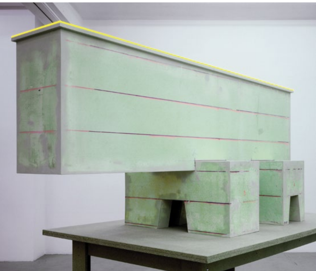
Thomas Schütte, 2018 Foto: Thomas Köster © Thomas Schütte

The upper floor displays three Männer im Wind (2018), their bare legs likewise sinking into the ground, and once again an experimental jump in scale is evident. Set up in the empty space of Kunsthaus Bregenz lit by daylight, the statues seem to have been abandoned there like strangely questioning companions.