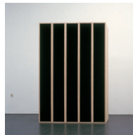
ohne Titel 1992, Dispersion, Pressspan 180 × 120 × 50 cm