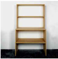
ohne Titel 1990, Pressspan 213,4 × 61 × 127 cm