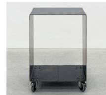
ohne Titel 1997, Stahl, Rollen 90 × 66 × 55 cm