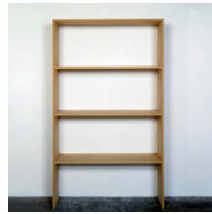
ohne Titel 1990, Pressspan 213,4 × 30,5 × 127 cm