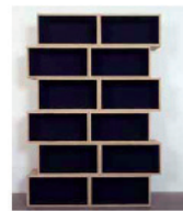
ohne Titel 1991, Dispersion, Pressspan 190,5 × 132,1 × 30,5 cm