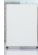
ohne Titel 2015, Pressspan beschichtet, Stahlrahmen auf Rollen 292 x 202 x 80 cm