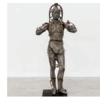
ohne Titel 2015, Bronze 227 x 100 x 74 cm