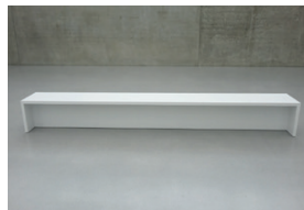
ohne Titel 2012, Acryllack, Pressspan 45 x 45 x 360 cm