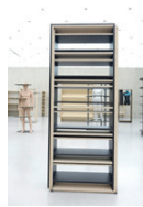
ohne Titel 2015, Pressspan 206 x 84 x 28 cm