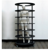
ohne Titel 2006, MDF, Polyester, Stahl 200 x 99 x 99 cm Sammlung Ringier, Schweiz