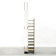
ohne Titel 2014, Holz, Sperrholz, Pressspan, MDF, diverse Materialien 299 x 57,5 x 56 cm