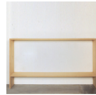
ohne Titel 1990, Pressspan 106,7 × 30,5 × 218,4 cm