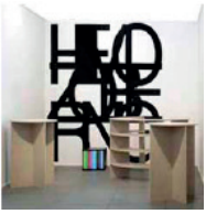
ohne Titel 2006, 2 Tische, 1 Thekenobjekt Courtesy Galerie Anselm Dreher, Berlin