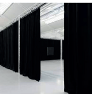
ohne Titel 2012, Molton, Vorhangschienen, Aluminium Truss Box 4,25 x 11,3 x 22 m