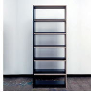
ohne Titel 2010, Pressspan 202 x 80 x 28 cm