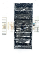
ohne Titel 2015, Federn, Kunstharzlack, Pressspan 206 x 84 x 28 cm