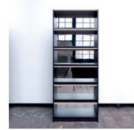
ohne Titel 2010, Pressspan, Acrylglasspiegel 202 x 82 x 28 cm