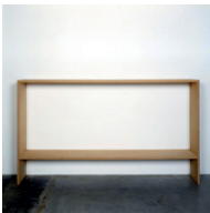
ohne Titel 1990, Pressspan 124,5 × 30,5 × 218,4 cm