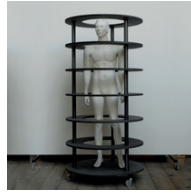
ohne Titel 2006, MDF, Polyester, Stahl 205 x 99 x 99 cm Courtesy Sammlung Ringier, Schweiz