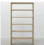
ohne Titel 1998, Pressspan 200 × 100 × 33,3 cm