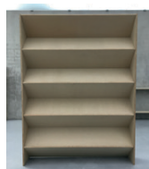
ohne Titel 2001, Pressspan 270 × 35 × 205 cm