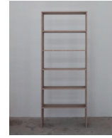
ohne Titel 2006, Pressspan 202 x 90 x 28 cm