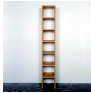
ohne Titel 1990, Pressspan 213,4 × 30,5 × 35,6 cm