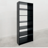
ohne Titel 2007, Plexiglasspiegel 202 x 80 x 28 cm