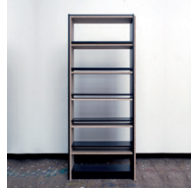
ohne Titel 2010, Pressspan 204 x 82 x 28 cm