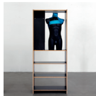
ohne Titel 2004, Tape, Kunststoff, Pressspan, 202 × 80 × 38 cm, Objekt: 92 × 100 × 30 cm